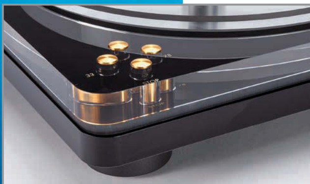
◀ Das transparente Acryl erlaubt faszinierende Einblicke. Das Laufwerk bietet sogar 78 Umdrehungen.

Der ECG1 bringt einen anerkannt hochwertigen und noch günstigen Arm mit: den zehn Zoll langen SA-750 EB des japanischen Lieferanten Jelco. Dieser S-Typ mit simpel auswechselbarer Headshell ist einfach in der Höhe verstellbar, besitzt am Gegengewicht eine präzise Skala für den korrekten Auflagedruck und hat sich tausendfach bewährt. Nur sein pinkfarbenedes Originalkabel gehört gegen ein besseres ausgetauscht, weil es die Räumlichkeit beschneidet und die oberen Lagen bissig wiedergibt. Plattenspieler vom Schlage des Electrocompaniet kann es klanglich so einbremsen wie Sparbereifung einen Sportwagen.