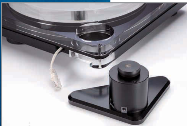
◀ Für den frei stehenden, 1,3 Kilogramm schweren „Motorblock“ ließen die Norweger hinten links ein Loch im Sandwich-Chassis. Er ist über ein PC-Kabel mit den Laufwerkstasten verbunden.